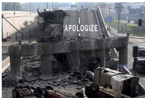
photo I APOLOGIZE