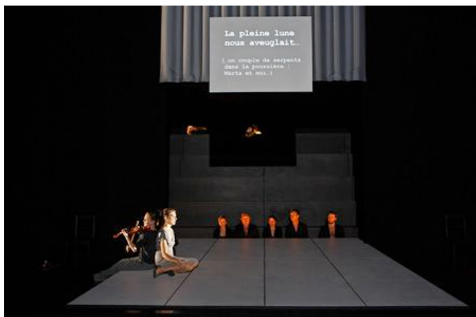
Partie IV.8