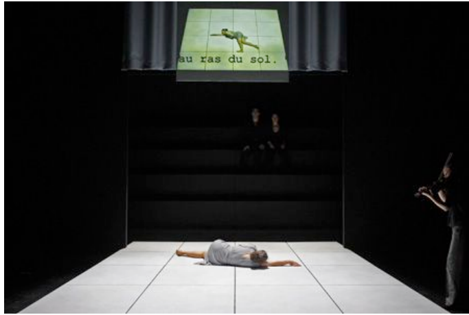
Partie II