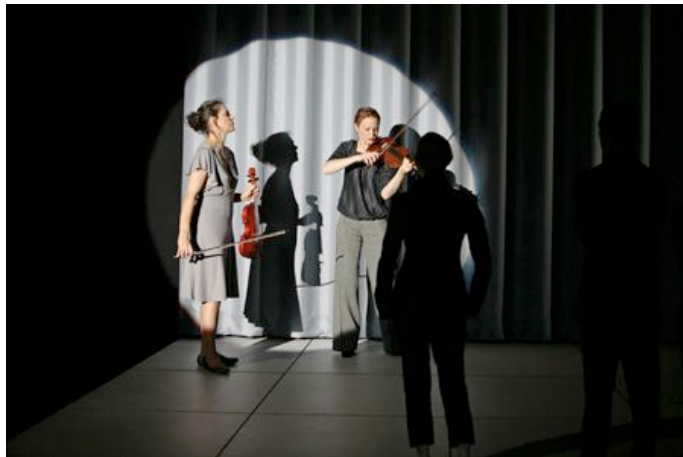
Partie III.12 / © Pascal Victor/ArtComArt